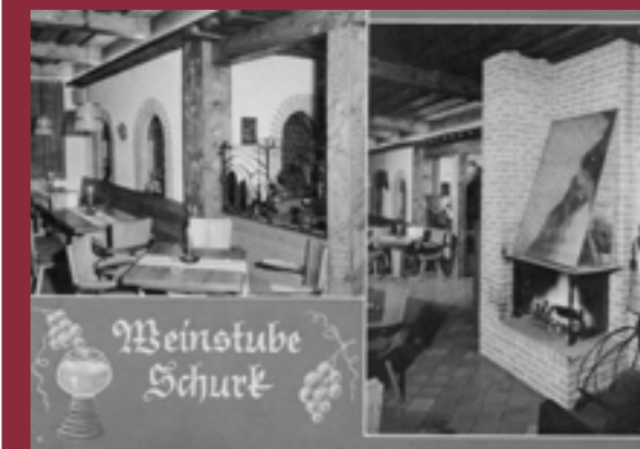
Postkarte aus den 70er Jahren.